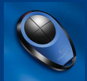
tousek Impulsgeberprogramm kompatibel und sicher