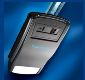
tousek Garagentorantriebe sparsam und schnell