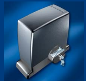
tousek Schiebetorantriebe kompakt und sicher