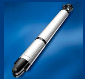
tousek Drehtorantriebe rationell und stark